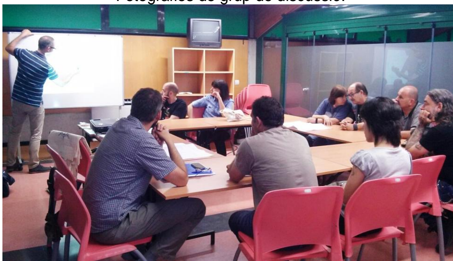
Fotografies de grup de discussió:

Cal respondre si l'equipament es donarà equipat amb ordinadors i/o telèfon.